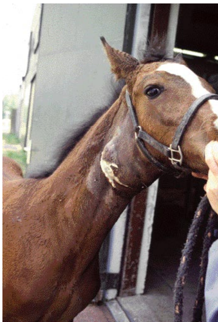
Droes bij een veulen, de keellymfeknoppen zijn geabcedeerd en opengebrosen.

jonge paarden gaat, zullen enkele dieren ernstige tot zeer ernstige symptomen vertonen, maar het grootste deel van de paarden zal alleen enkele dagen koorts hebben, sloom zijn en soms wat snotteren. Als het bedrijfstechnisch mogelijk is, moeten zieke dieren volledig geïsoleerd worden en liefst door een apart iemand verzorgd worden. Als er geen aparte verzorger is, dan moet gezorgd worden voor zorgvuldige hygiëne (als laatste de zieke paarden verzorgen met aparte overal, apart gereedschap en goed handen wassen). Een bedrijf waar droes heerst moet geen paarden van buiten accepteren en ook geen paarden naar andere bedrijven laten gaan. Als op een bedrijf steeds opnieuw uitbraken van droes optreden moet, in overleg met de dierenarts, serieus gezocht worden naar de drager(s) van de bacterie.