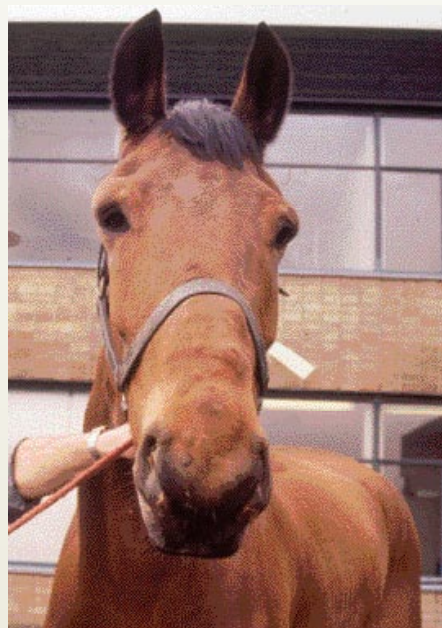
Van de ziekte Morbus Maculosus kan een paard een dik hoofd krijgen ook wel morbus nijlpaardhoofd genoemd.

Er is voor droes een levend vaccin geregistreerd (dat wil zeggen een vaccin waarin aangepaste levende bacteriën zitten die een paard wel antistoffen bezorgen, maar niet echt ziek maken). Deze vaccinatie mag vanaf een leeftijd van vier maanden worden gegeven en wordt door de dierenarts in de bovenlip gespoten. Dieren met een hoog risico moeten vervolgens elke drie maanden worden gevaccineerd en dieren met een normaal risico