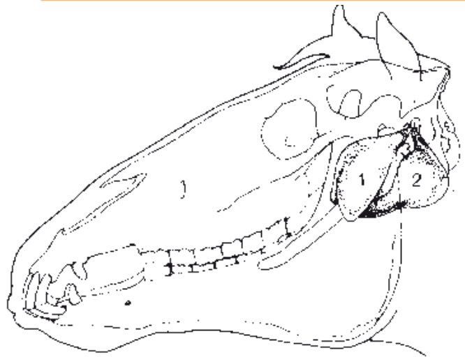
Ligging van de luchtzak: 1 = buitenste deel en 2 = binnenste deel

optreden van abscessen elders in het lichaam, bijvoorbeeld in de buik. Deze abscessen mogen natuurlijk niet open gaan en daarom moeten paarden met verslagen droes juist wel heel lang op antibiotica. Morbus maculosus is een moeilijke naam voor een ziekte, vaak enkele weken na een droesinfectie, waarbij het dier koorts krijgt, sloom is, niet wil eten, hoofd en benen erg dik worden (nijlpaardhoofd en olifantsbenen) en puntbloedingen optreden in de slijmvliezen. Deze ziekte treedt op als gevolg van een overgevoeligheidsreactie en direct de hulp van een dierenarts inroepen is van groot belang. Longontsteking ten gevolgen van verslikken komt gelukkig maar zelden voor, maar ook hier geldt dat tijdig diergeneeskundige hulp inroepen erg belangrijk is. Er zijn enkele aanwijzingen dat verslagen droes en morbus maculosus misschien juist optreden in die gevallen waarin paarden met antibiotica zijn behandeld, terwijl er al sprake was van