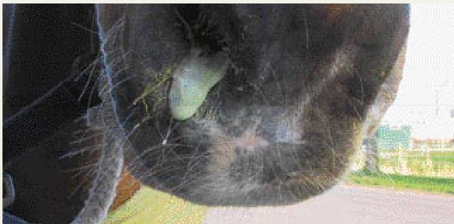
Typische dikke pus zoals bij droes kan voorkomen.

bijeenkomsten moeten natuurlijk niet gehouden worden op een bedrijf waar droes heerst. Droes proberen te 'verbergen' is erg dom, want als het later, na contacten met zieke paarden, toch elders uitbreekt, is vaak niet met 100% zekerheid te bewijzen wie de 'dader' is, maar hopelijk krijgt deze wel last van zijn eigen geweten. Openheid en eerlijkheid is de beste manier om de negatieve gevolgen van droes zoveel mogelijk te beperken. Als er verstandig wordt opgetreden is droes meestal een redelijk onschuldige ziekte van jonge paarden, waarbij er inderdaad wel af en toe ernstige gevallen soms zelfs met dodelijke afloop voorkomen. Bij onverstandig handelen, kunnen volwassen paarden die in een omgeving komen met een hoge infectiedruk (veel bacteriën) de aandoening (weer) krijgen en kan droes een echte bedreiging vormen. De voor- en nadelen van vaccinatie kunnen per situatie het beste met de behandelende dierenarts doorgesproken worden, want hij of zij kent de paarden en bedrijfsomstandigheden het beste. ●