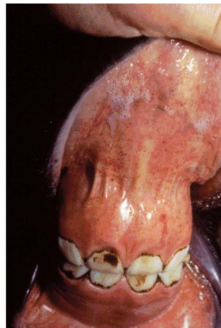
Puntbloedingen in de slijmvliezen kan een symptoom zijn van de ziekte Morbus Maculosus.

elke zes maanden. Dit maakt deze vorm van bescherming wel kostbaar.