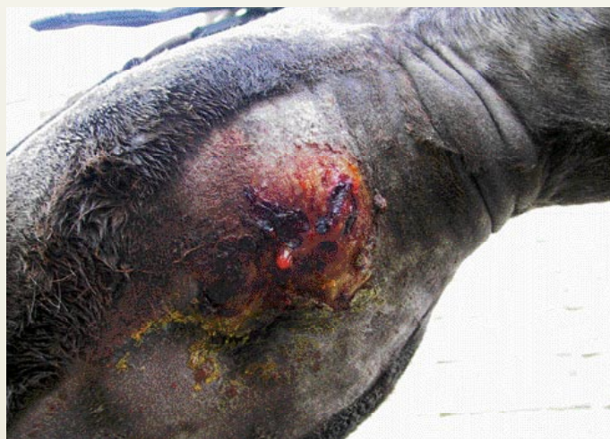
Droes bij een volwassen paard tussen de kaaktakken.

Besmettelijke paardenziekten komen al eeuwen voor. Door het vele reizen met paarden, soms wereldwijd en door allerlei contacten op wedstrijden, keuringen en andere hippische bijeenkomsten kunnen besmettelijke aandoeningen zich nu vaak gemakkelijker verspreiden dan vroeger. Iedere eigenaar heeft daarin een eigen verantwoordelijkheid. Met een paard van een bedrijf waar een besmettelijke ziekte heerst, moet je niet naar andere paarden gaan en andersom de eigenaar van een bedrijf die een besmettelijke ziekte op stal heeft, moet geen vreemde paarden toelaten op zijn terrein. Dat geldt natuurlijk niet alleen voor de in dit artikel beschreven aandoening droes, maar voor alle besmettelijke paardenziekten.